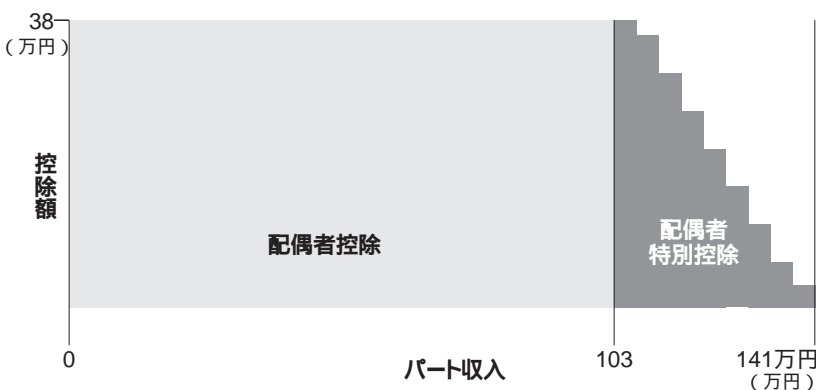
配偶者控除と配偶者特別控除の関係

偶者に相続税はかかりません。 一億六千万円 正味の遺産額に配偶者の法定相続分（子供がいる場合は二分の一）を掛けた金額 * この制度は、財産の維持形成に対する配偶者の内助